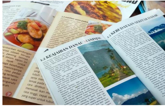
Gambar 2. Desain dan hasil karya buku suduik bakaba

Hasil dari proyek serta bentuk tugas akhir proyek yang dikumpulkan merupakan penentu apakah berhasil proyek tersebut dilaksanakan apa tidak. Menurut hasil wawancara dengan bapak Dolly S. Pd selaku ketua pojek suduik bakaba beliau mengatakan: