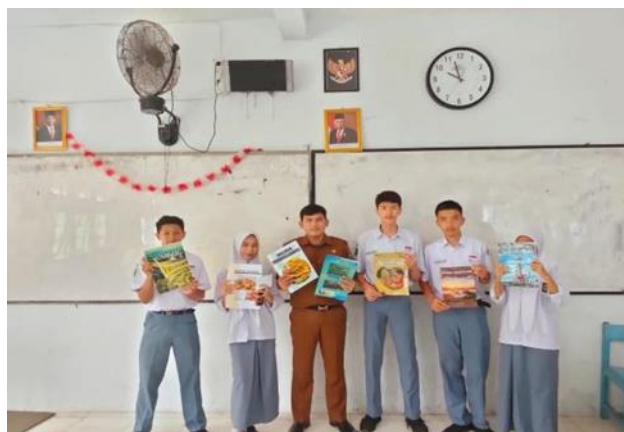
Gambar 1. Presentasi karya buku suduik bakaba

Dalam pelaksanaan proyek suduik bakaba tentunya sudah dirancang seperti apa hasil akhir proyek yang ingin dicapai dalam proyek.