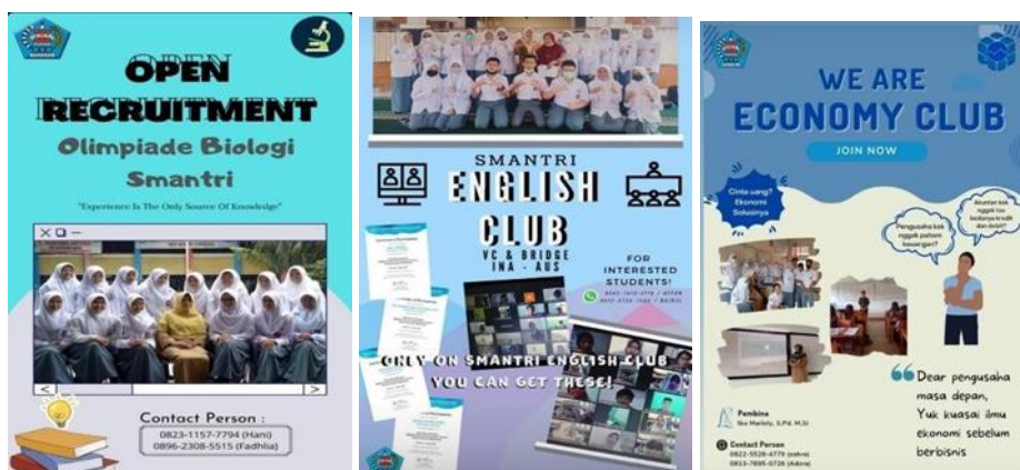
Gambar 2. Brosur atau poster perekrutan Study Club

“...Biasanya kami pihak sekolah menginformasikan mengenai perekrutan Study Club ini kepada peserta didik di saat masa orientasi peserta didik baru atau dikenal dengan masa pengenalan lingkungan sekolah. Selain itu, biasanya penyebaran informasi dilakukan dengan penyebaran brosur dan pemberian informasi melalui media sosial. Dalam perekrutan Study Club ini biasanya dilakukan oleh kakak kelas atau senior pada studi club tersebut. Selain itu, dalam perekrutannya setiap peserta didik dapat ikut serta mendaftar tapi tidak semua peserta didik dapat bergabung sebab peserta didik harus melewati beberapa tahap penyeleksian. Untuk tahap penyeleksian yang disesuaikan dengan bidang mata pelajaran masing-masing (wawancara pada 2 Mei tanggal 2024)”.