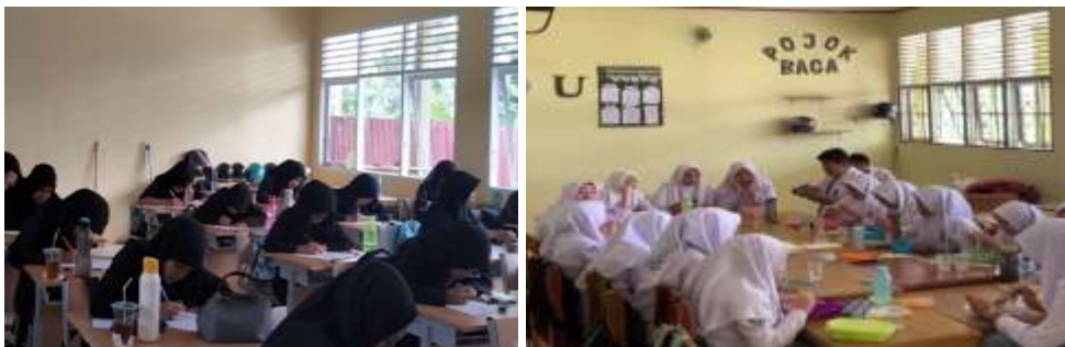
Gambar 1. Siswa Membawa Bekal Ke Sekolah

Berikut dokumen siswa membawa bekal dan minum ke sekolah pada masa sistem full day school .