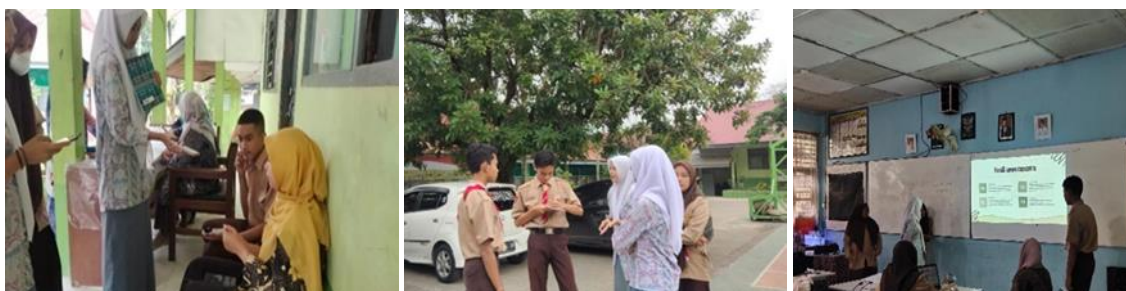
Gambar 1. Pembelajaran dengan Student Centered Learning